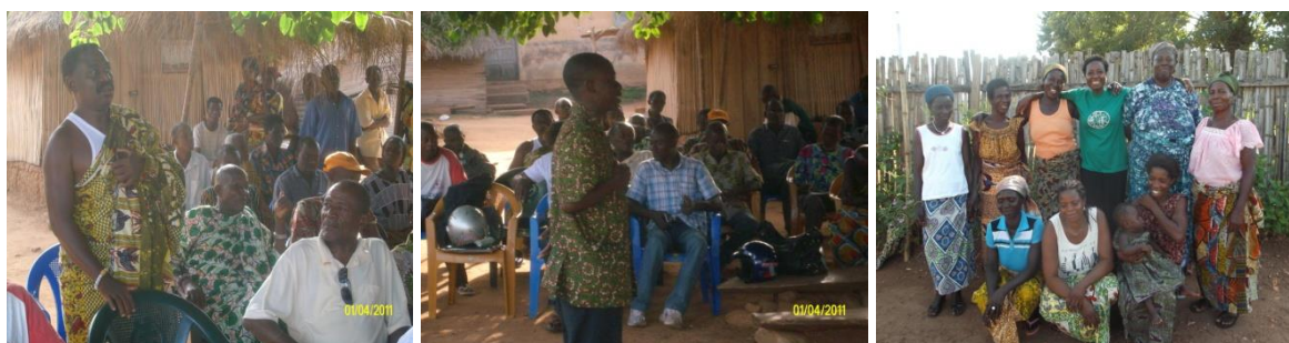
Campagne de sensibilisation pour la promotion des intrants naturels au détriment des intrants chimiques