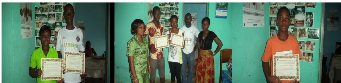
Remise de diplômes aux jeunes initiés sur les TIC

Après une évaluation quinze (15) des dix-sept (17) ont été récompensés d'une attestation de fin de formation. Nous rappelons que la formation a duré six (06) semaines.