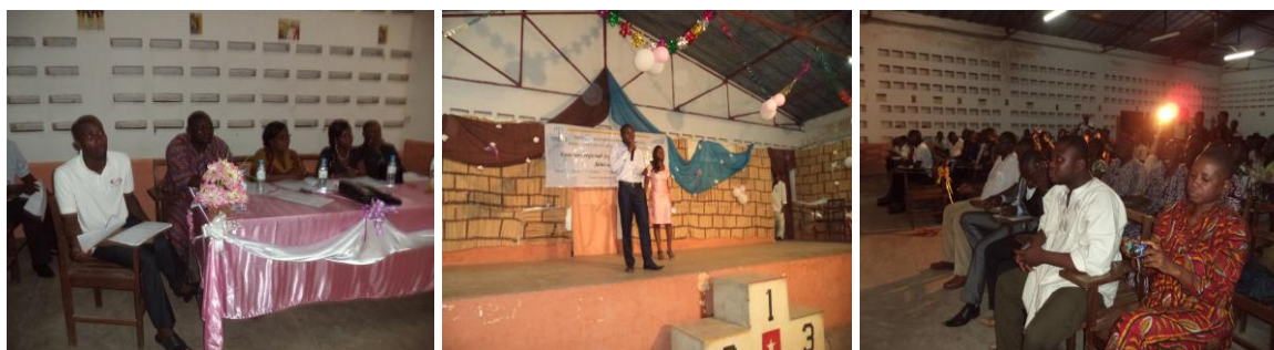
Concours régional de plaidoirie pour la lutte contre les violences faites aux femmes à Atakpamé

Au total sept (07) documents de plaidoiries ont été sélectionnés et ont fait l'objet de gratification des auteurs. Ces sept (07) récipiendaires sont autorisés à aller présenter à Lomé leur plaidoirie devant un jury national puisque ce concours prend en compte également les autres régions du Togo.