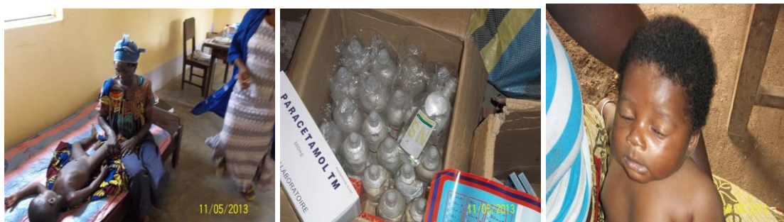
Poste de secours de Gbétiya-Kadjafè

Les impacts sont réels et existent dans cette localité. Nous avons reçu le concours du Directeur Préfectoral de la préfecture de l'Amou et l'appui local de la chefferie traditionnelle de la localité, ces environs et le Comité Villageois de Développement (CVD).