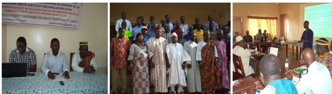
Atelier d'échanges sur le rapport de la CVJR avec les leaders communautaires

Les communications et interventions au cours de cette année a retracé les grands axes des travaux de la CVJR et la responsabilité des leaders communautaires, religieux et chefs traditionnels pour la mise en œuvre des recommandations de la CVJR. L'atelier a connu la présence d'éminent communicateurs et personnes ressources du pays à savoir :